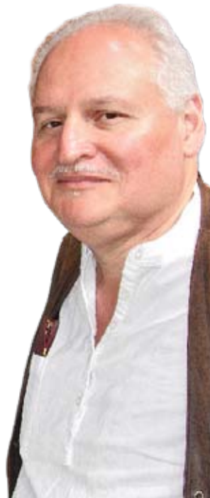
Esta foto fue tomada en julio de 2010 y es una de las imágenes más recientes de Ilich Ramírez Sánchez